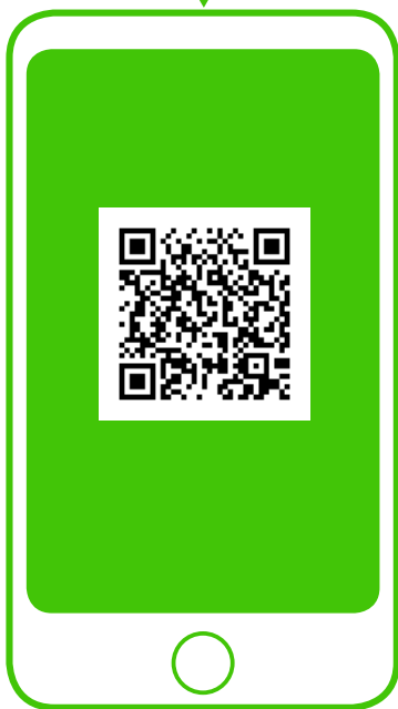
※新型コロナウイルス対策パーソナルサポート (行政) QRコードから登録