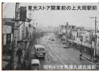
東光ストア開業前の上大岡駅前