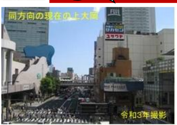
同方向の現在の上大岡