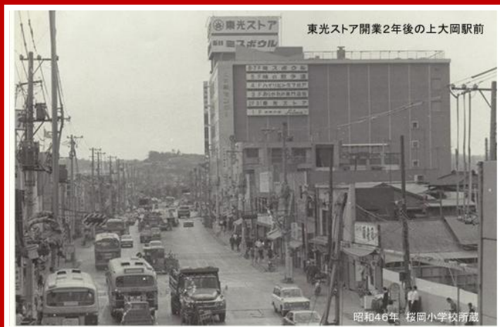
東光ストア開業2年後の上大岡駅前

江戸時代までさかのぼり、現在までの上大岡がどのように歩んできたのか？自分たちの足で調べ・集めた貴重な資料を基にお話を伺います。私たちの住んでいるまちを知ることは未来を考えることにつながります。